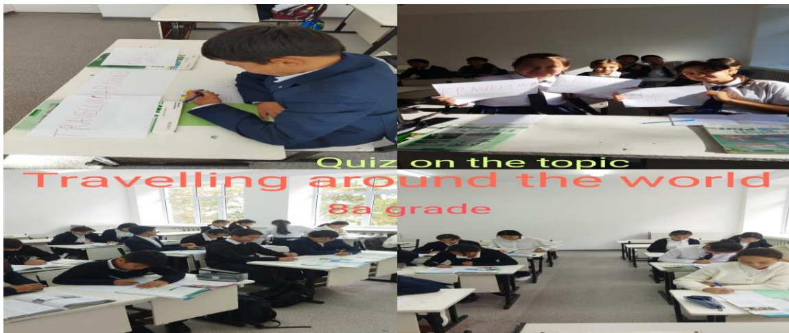
Ағылшын тілі пәнінің мұғалімі «Travelling around the world» интеллектуалды ойынын өткізді.