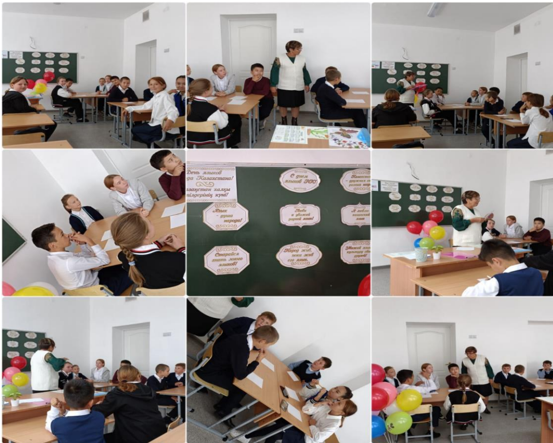
Среди учащихся 5б-7б проводился конкурс посвященный дню языков Казахстана.