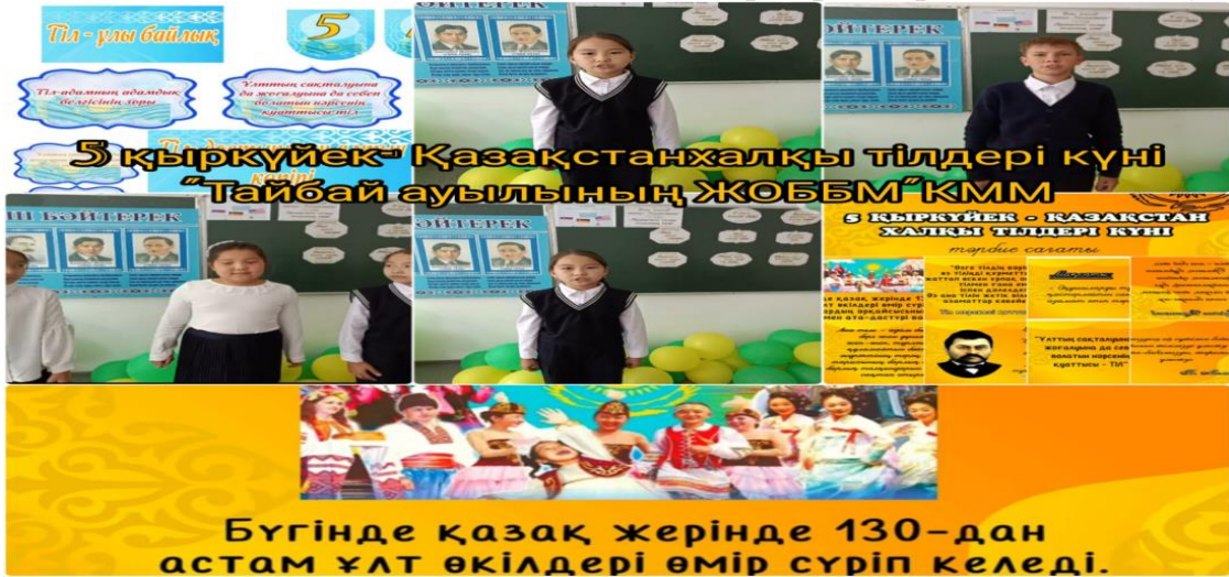
Қыркүйектің 5-жұлдызында жалпы Қазақстандық ашық диктант болды.

2023-2024 оқу жылында Қазақстан халқының тілдері күніне орай 5-16 қыркүйек аралығында гуманитарлық пәндер бірлестігінің онкүндік апталығы жоспарлы түрде өз жұмысын аяқтады. Апталықтың ашылуынан бастап, сыныптан тыс іс - шаралар мен жоспарланған іс-шаралар белсенді әрі жауапкершілікпен өтті. Аптаның бірінші күні «Тіл - әр халықтың байлығы» атты Қазақстан халқының тілдері күні мерекесінің ашылуы өтті.