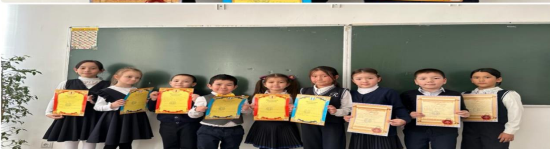
5-11 сыныптар қазақ тілінен емтихан тапсырды.